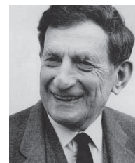
David Bohm, kvantový fyzik a filozof